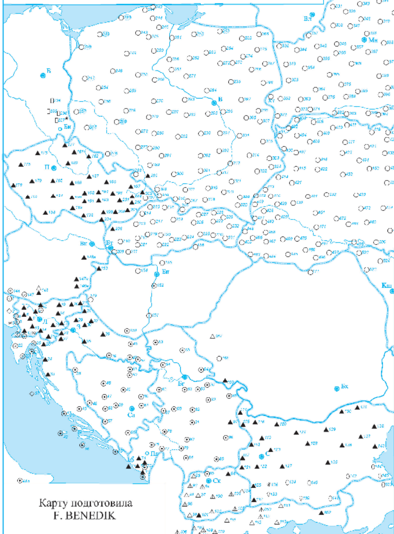
Карту подготовила F. BENEDIK